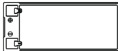
F2 (FASTON TAB 250)